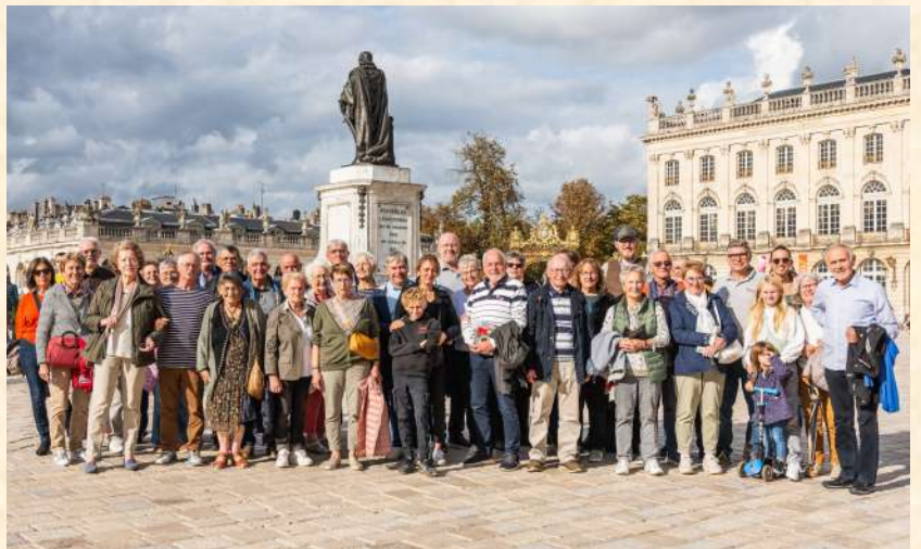
Le groupe en visite sur la place Stanislas de Nancy

Pour 2026, deux dates de rencontres sont donc inscrites au calendrier des 40 ans du jumelage, les 16 et 17 mai à Wörrstadt et les 12 et 13 septembre à Arnay le Duc.